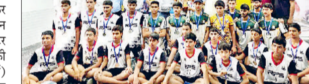
महेंद्रगढ़। विजेता आरपीएस की वालीबॉल टीम।