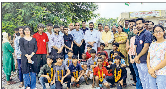
सोनीपत। कार्यक्रम के दौरान उपस्थित विधायक, मेयर, पार्षद एवं अन्य।